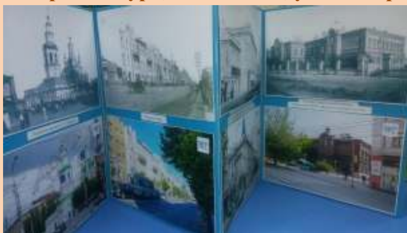
Папки-передвижки, с изображением домов