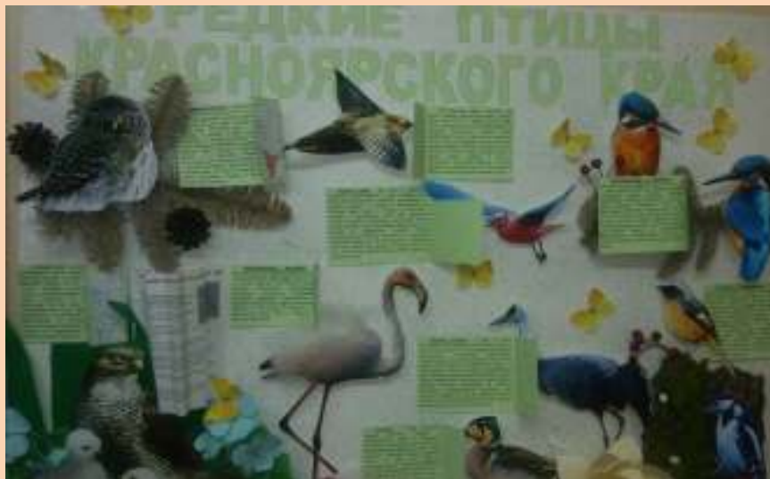
Газета «Редкие птицы Красноярского края»