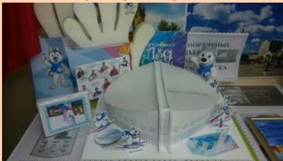
Макет дворца сорта имени Ивана Ярыгина.