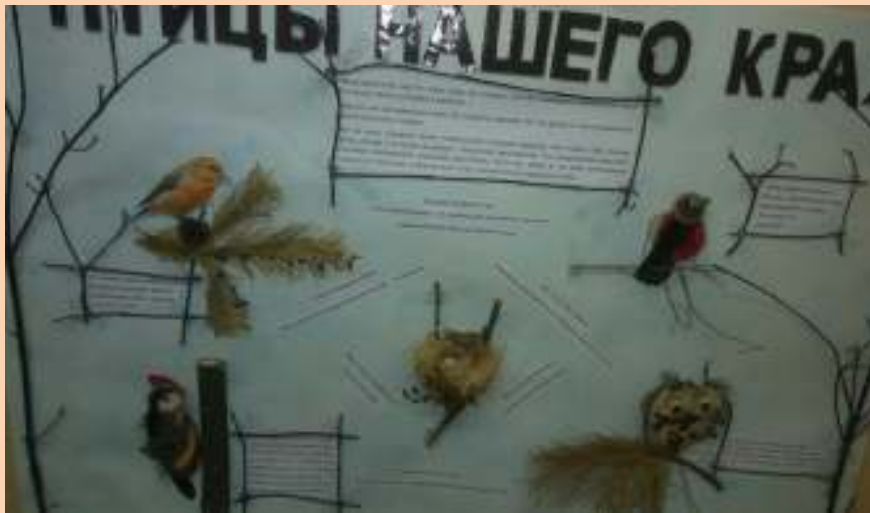
Газета «Птицы нашего края»