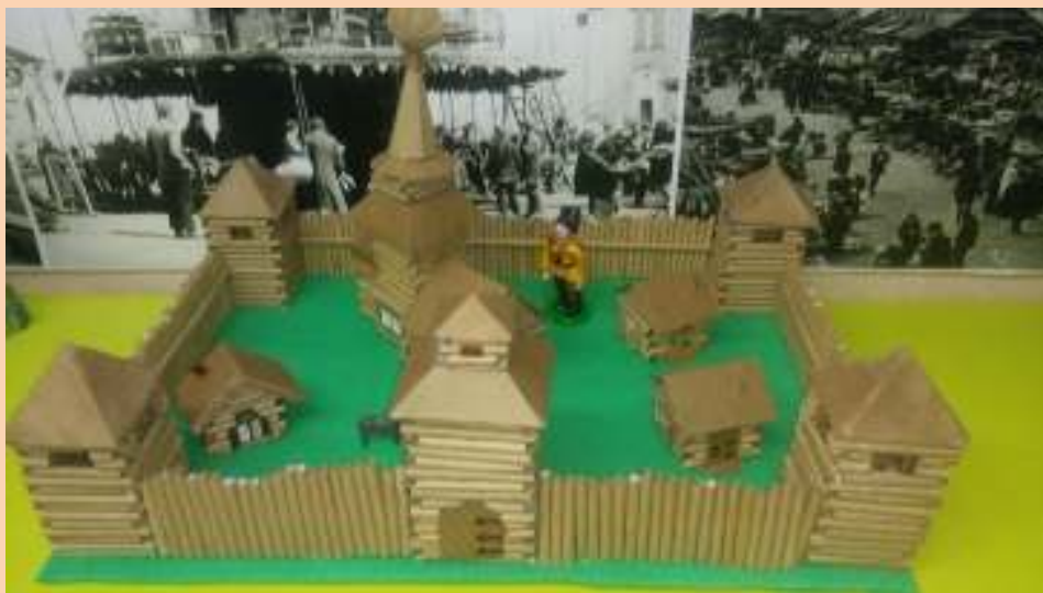
Макет Красноярского острога