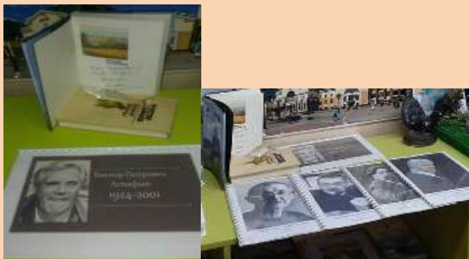
Альбомы: Знаменитые люди города