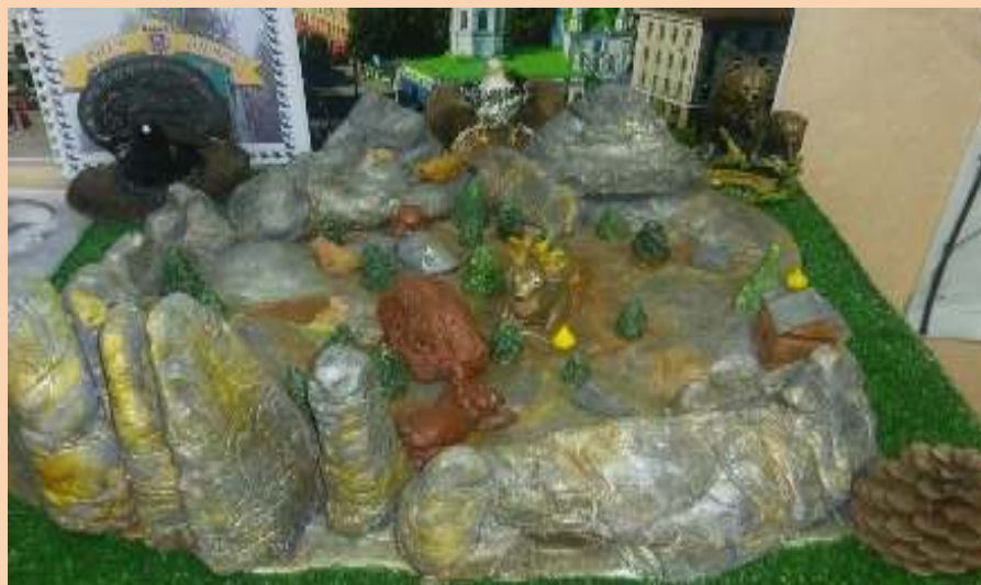
Макет заповедника столбы