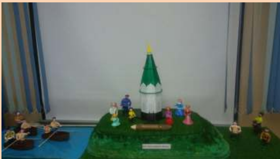
Макет часовни Параскевы Пятницы