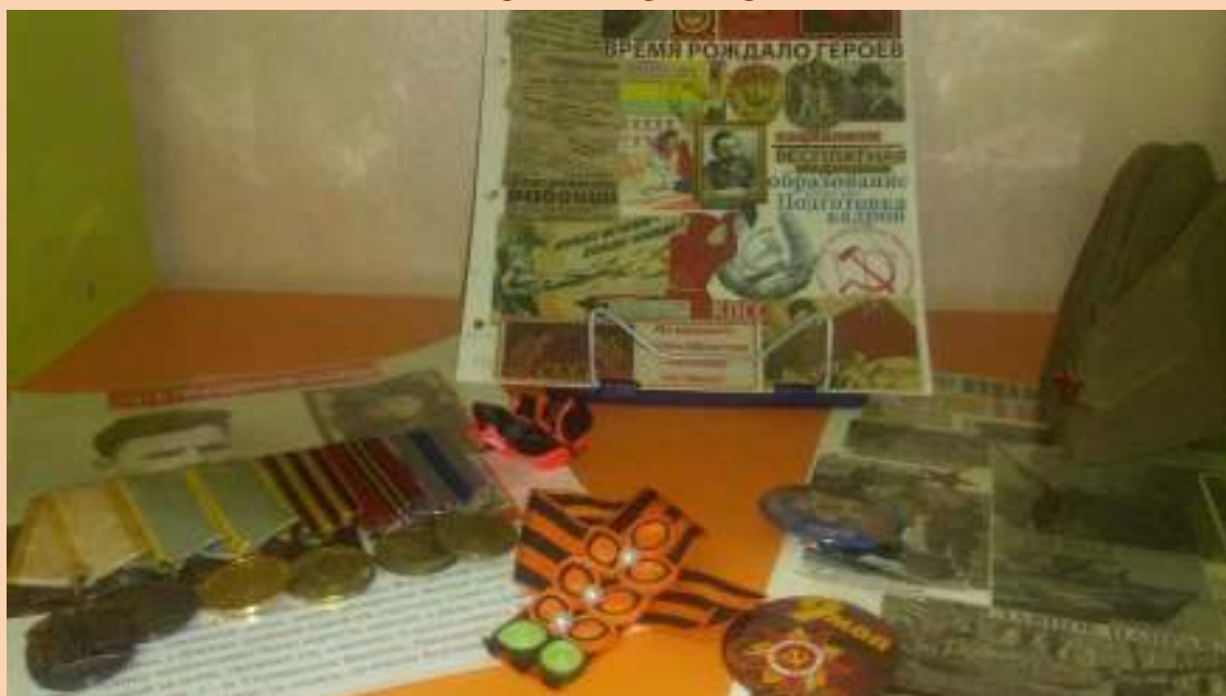
Материал о Красноярцах участниках Великой отечественной войны, медали, вырезки газет, пилотка, кiset под табак.