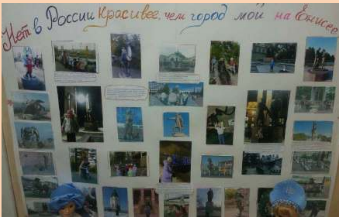
Газета: «Нет в России красивее, чем город мой на Енисее»