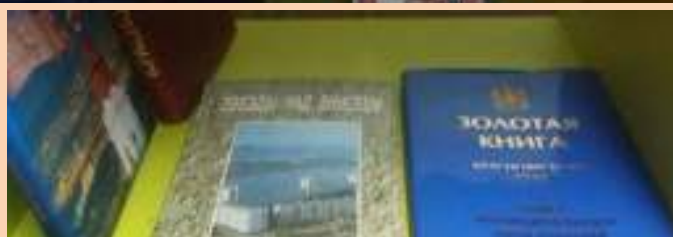
Литература о городе Красноярске