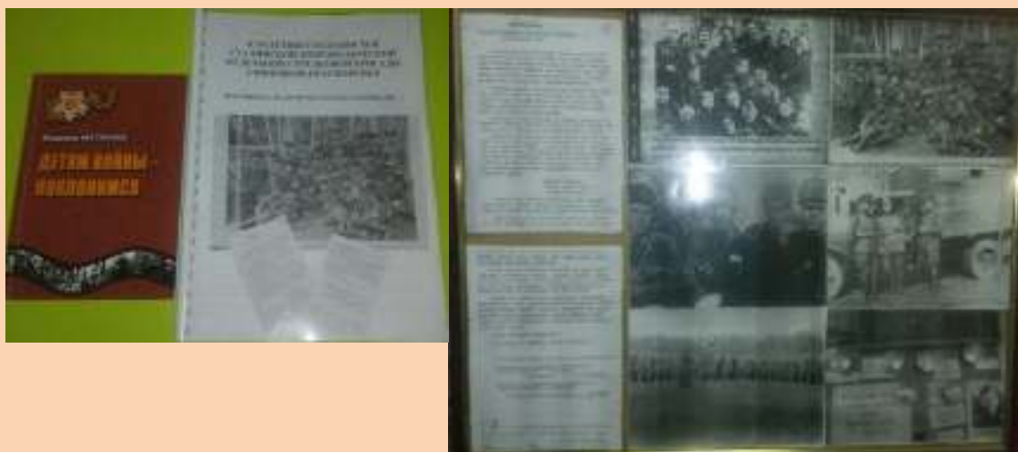
Материал к 75-летию 78 Сталинской Добровольческой отдельной стрелковой бригады сибиряков – Красноярцев