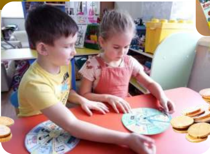
Играем в магазин